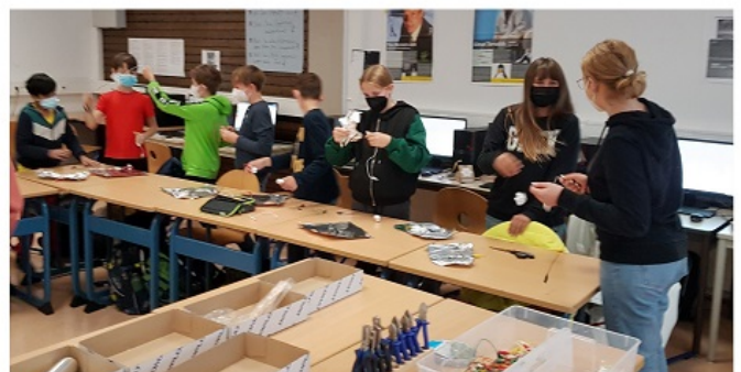
Beim zweiten Workshop stand der sinnvolle Einsatz der Technik im Vordergrund - mit Feuchtigkeitssensoren in Blumenerde sollte je nach Zustand die Wasserpumpe mit Hilfe des Callope angestartet werden. Zu Beginn des Workshops wurden die Teilnehmer zum